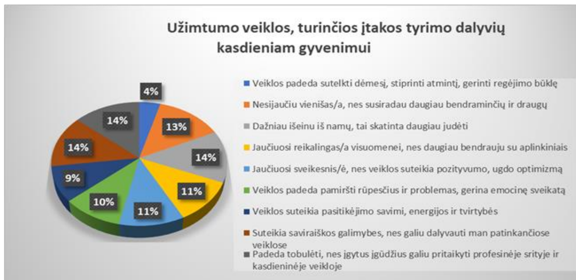
2 pav. Užimtumo veiklos, turinčios įtakos tyrimo dalyvių kasdieniam gyvenimui

Buvo siekiama išsiaiškinti užimtumo veiklų įtaką kasdieniam respondentų gyvenimui (žr. 2 pav.).