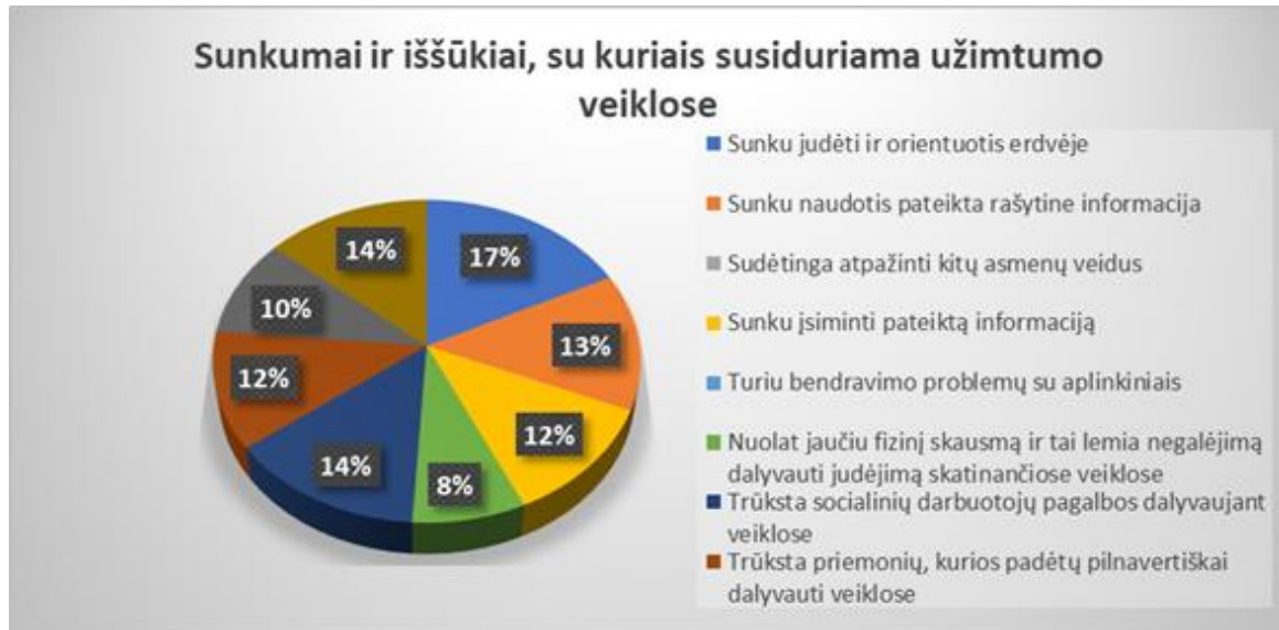
3 pav. Sunkumai ir iššūkiai, su kuriais susiduriama užimtumo veiklose

Tyrimo metu buvo klausta, su kokiais sunkumais ir iššūkiais užimtumo veiklose susiduria lengvą regos negalią turintys asmenys (žr. 3 pav.).